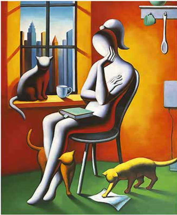
“FELINE DREAMS” 56x70 CM