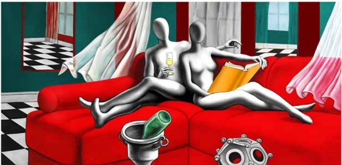
“ ELEGANCE IN ENLIGHTENMENT” 120x70 CM