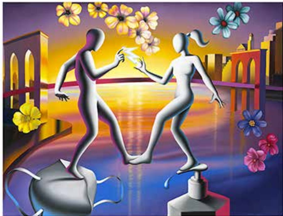
“THE FUTURE IS OURS” 65X56 CM