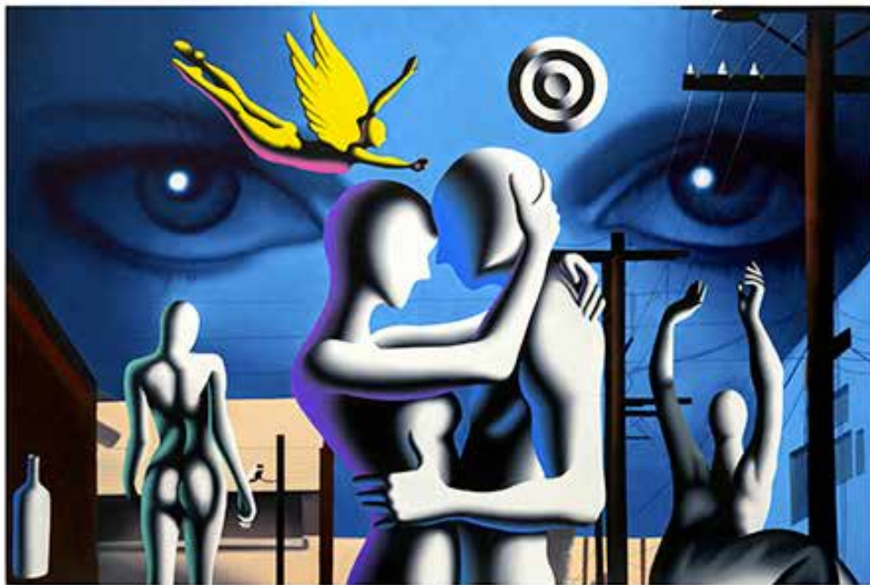
“THE ALTERNATING CURRENT OF DESIRE” 74x57