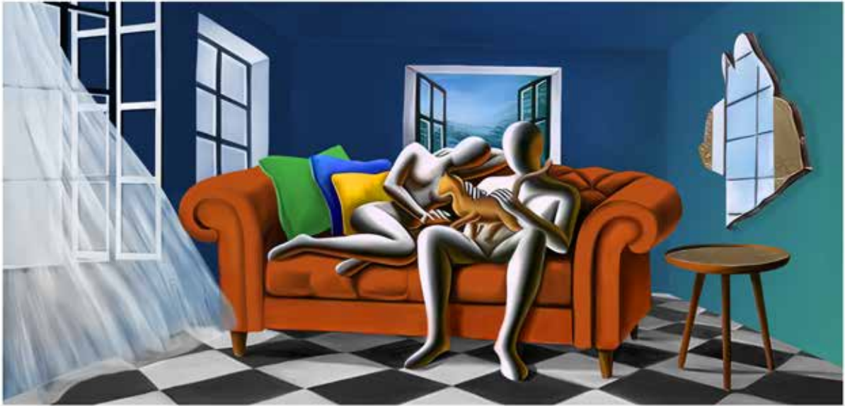
“ THE BREEZE OF TRANQUILITY” 120x70 CM