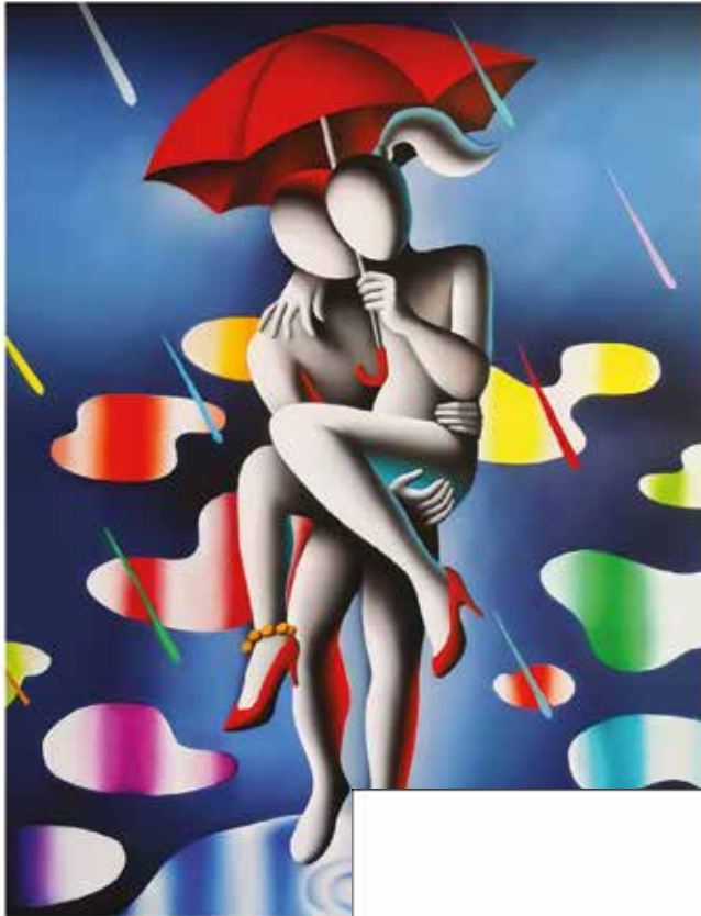
"PASSION IN THE RAIN" 56x70 CM