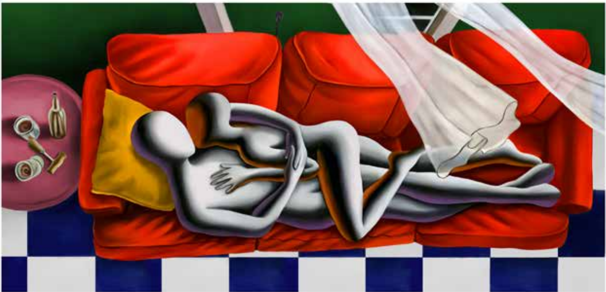
“ENDLESS LOVE” 90x55 CM