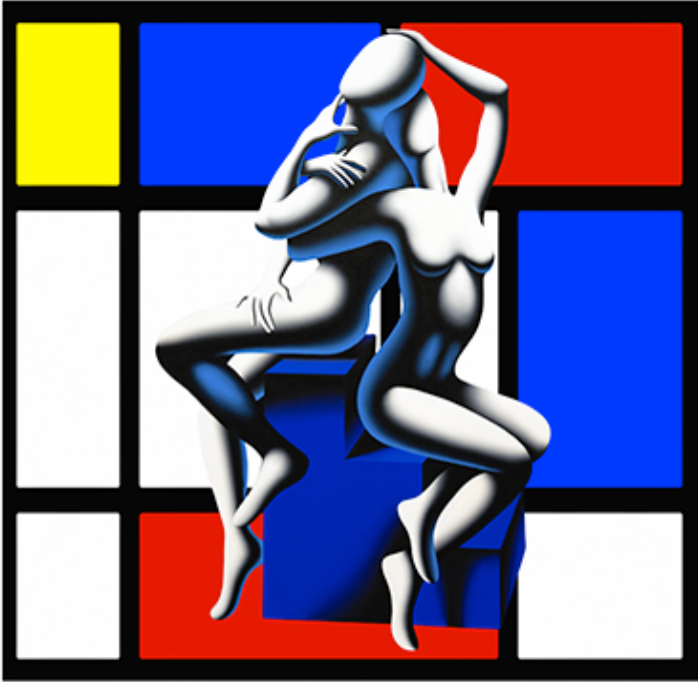
“BEYOND BOUNDARIES” 60x60 CM