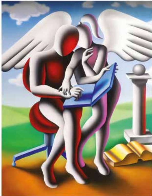
“DIVINE GIUDANCE” 56x70 CM