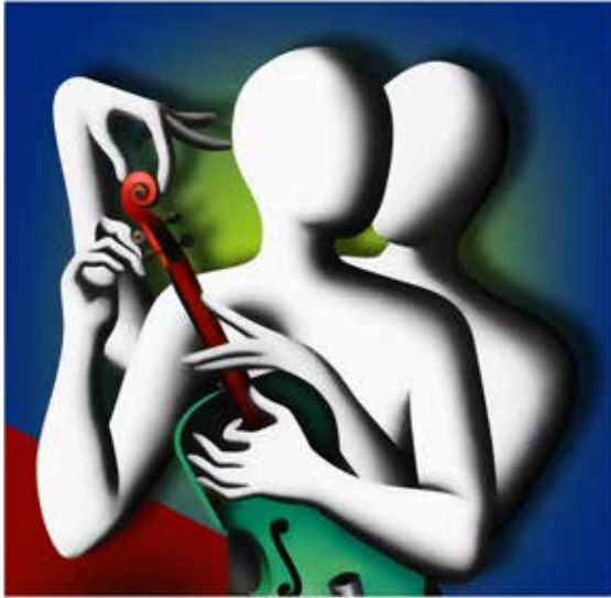
“ARMONY IN MOTION” 55x57 CM