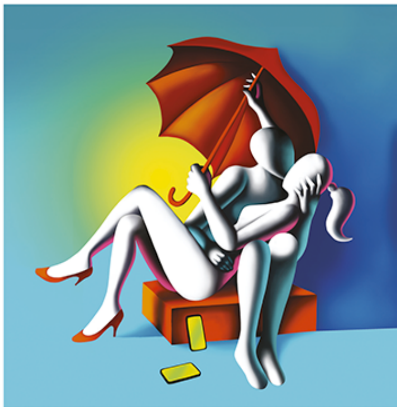
“LIBERI DAL MONDO VIRTUALE” 68x70 CM