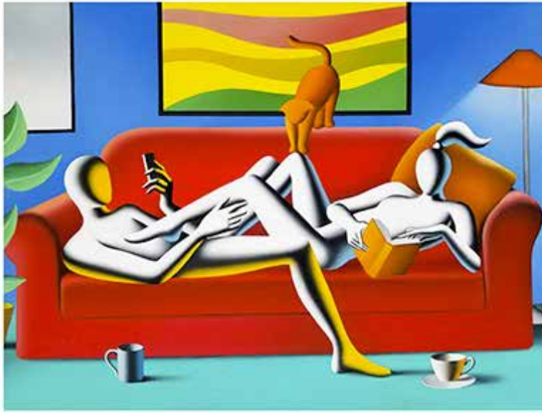
“THAT PERFECT MOMENT” 57x67 CM