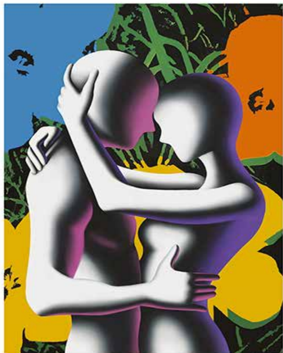
“LOVE IN BLOOM” 52x70 CM