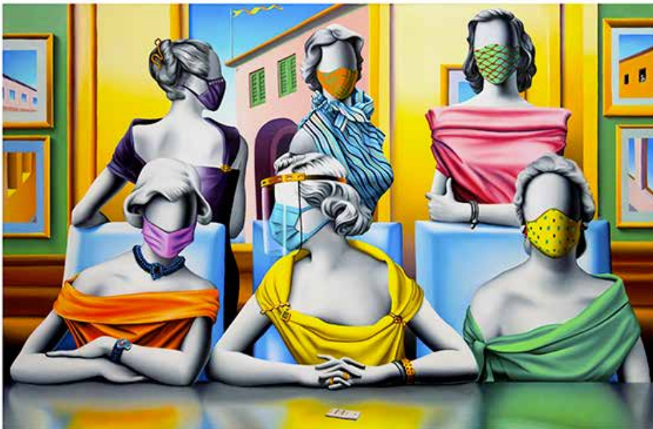
“THE CORONIALS” 92x68 CM