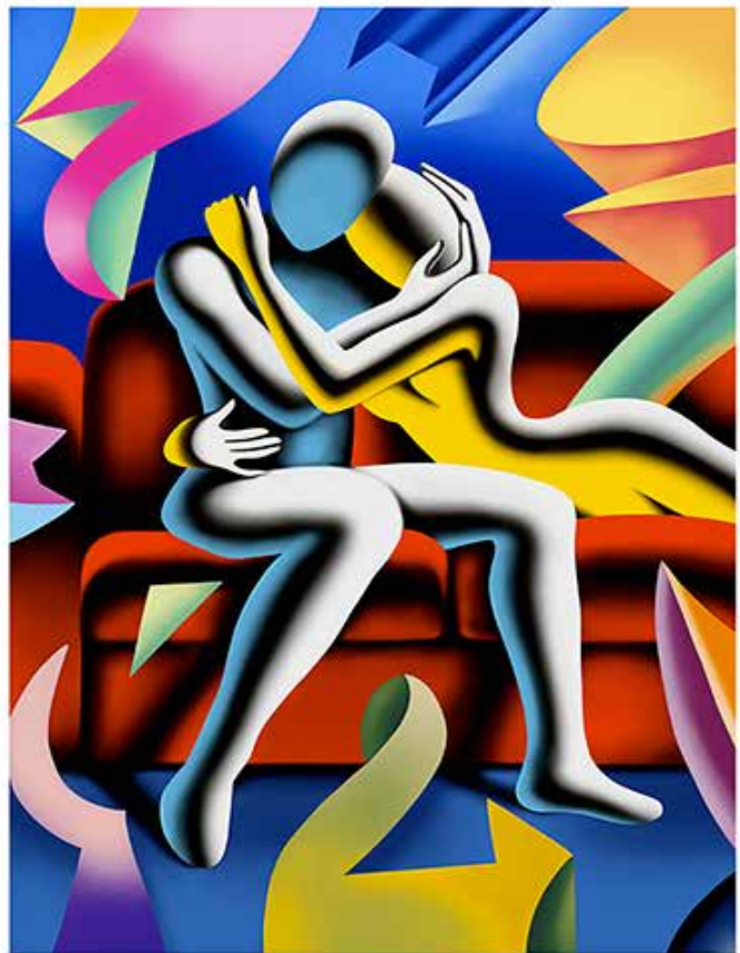
“PURE ECSTASY” 56X806 CM