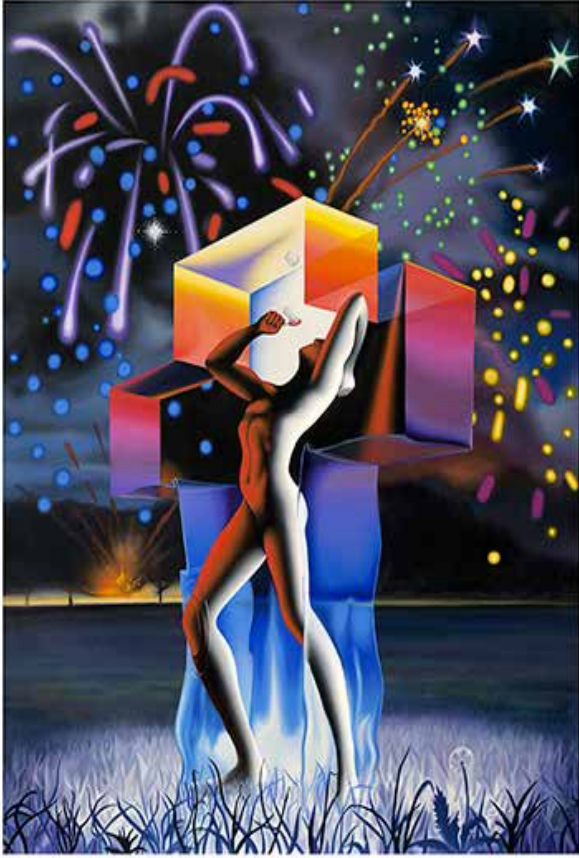
“FREE AT LAST” 53x68 CM