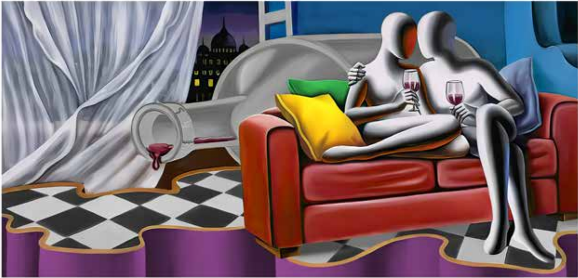
“OUR SECRET” 90x55 CM