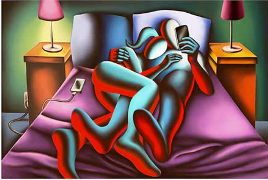
“JUST LIKE YOU PROMISED” 77x59 CM