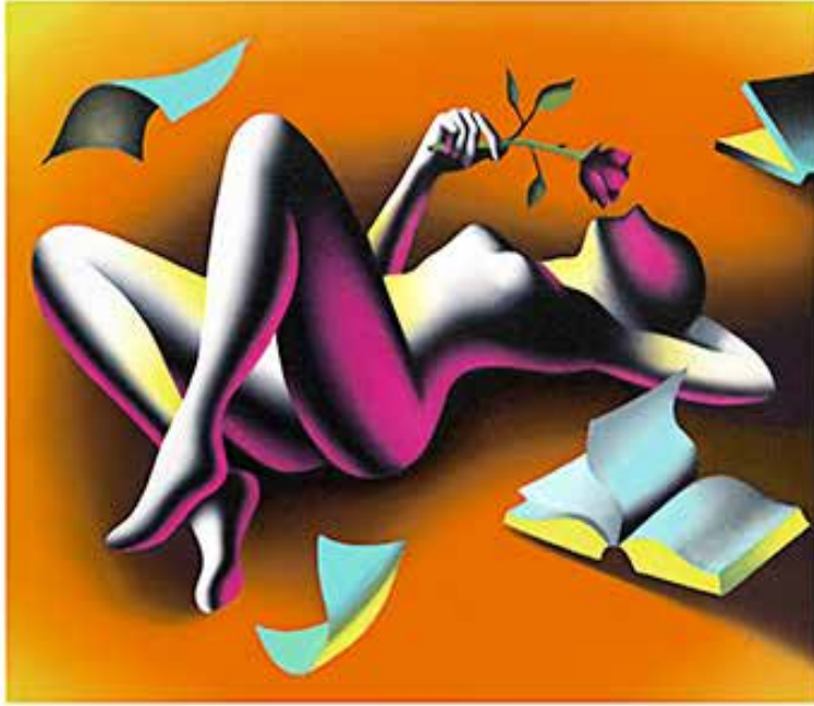
“SWADISTHANA” 47x44 CM