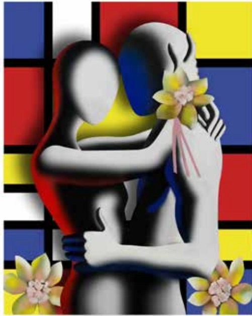
“FOREVER IN BLOOM” 45x55 CM