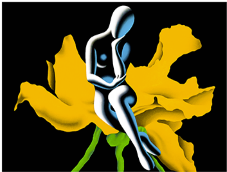
“EUPHORIC DEVOTION” 52x44 CM