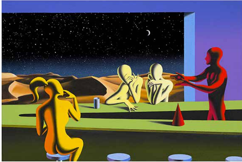
“WINDOW TO BEYOND” 74x57 CM