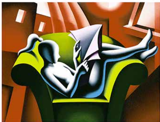
"THE LAST WORLD" 47x43 CM