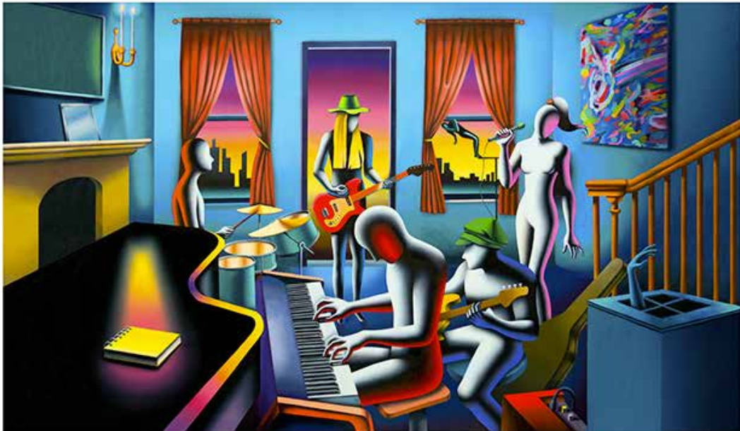
“THE MYSTIC CHORDS OF MEMORY” 98x66 CM