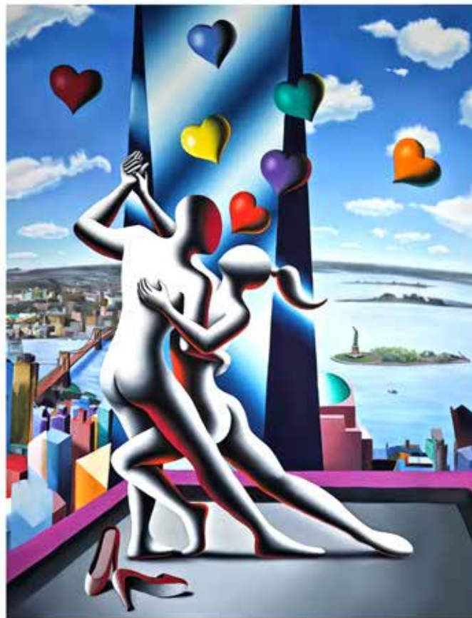
“CITY OF DREAMS” 63x80 CM