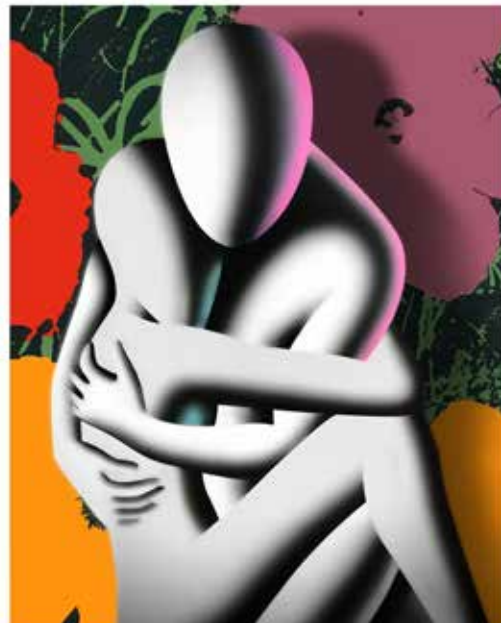
“BLOSSOMING DESIRE” 45x55 CM