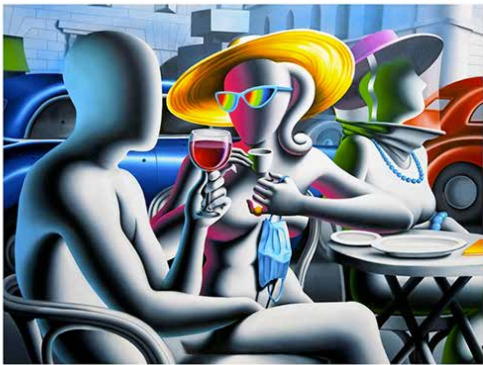
“GLAMOUR AT NOON” 82x68 CM