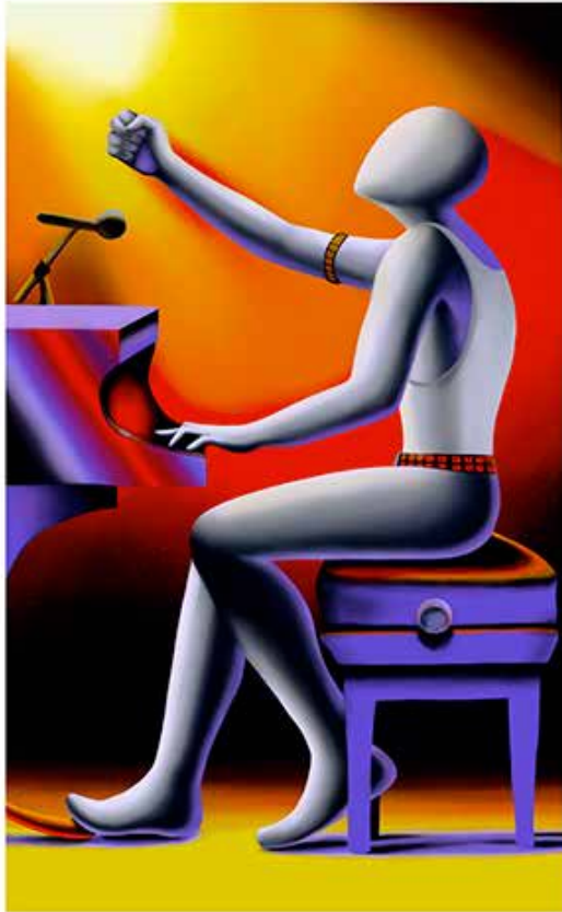
“BREAKING FREE” 48x75 CM