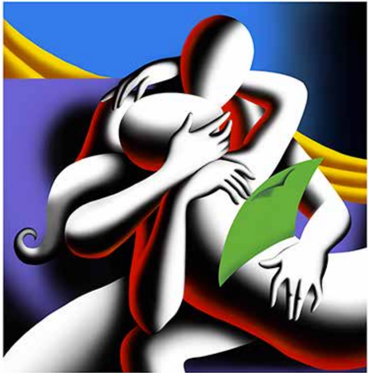
“TRANSCENDING THE MATERIAL” 60X64-CM