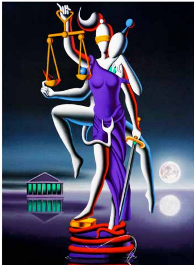
"ALWAYS GETTING HIS WAY" 48x63 CM