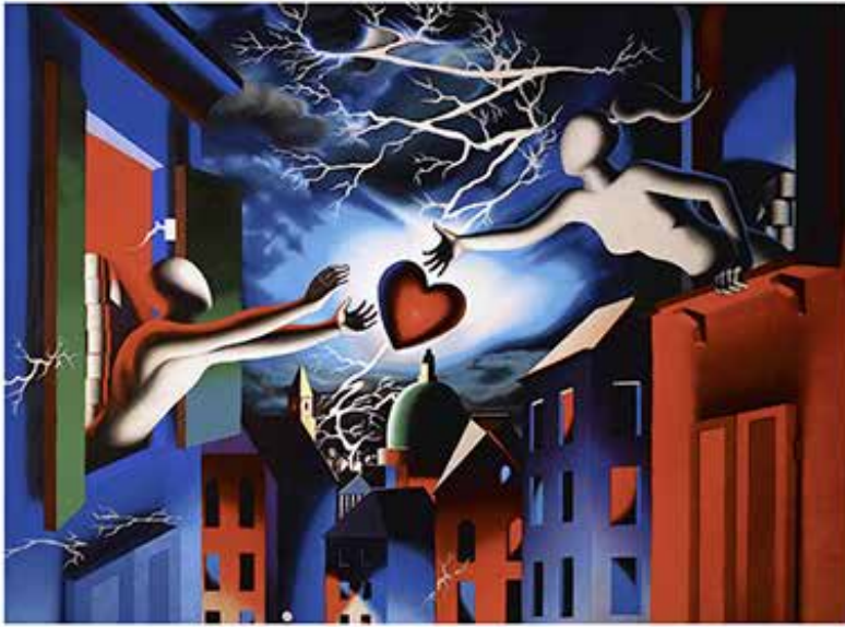
“REACHING OUT (NOCTURNAL-PASSION)” 63x 53CM